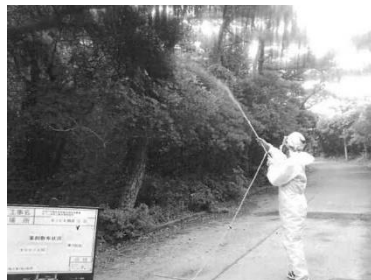
②：松くい虫地上散布