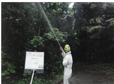
①：トビモンオオエダシヤク地上散布