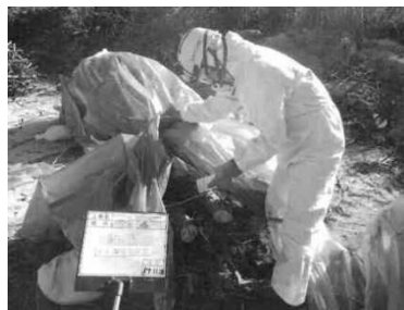
④：松くい虫伐倒駆除