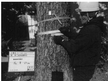
③：松くい虫樹幹注入