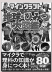
マイクラ職人組合