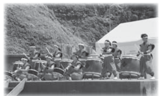
▲風神組のウェルカムプログラムの様子