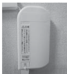
▲光コンセント写真

なお、平成29年の光回線スタート時に実施した分担金無料での光コンセント設置は、回線契約をしていただく前提で行っております。光コンセントを設置済みで回線契約をされていない方は、契約をしていただくようお願い致します。