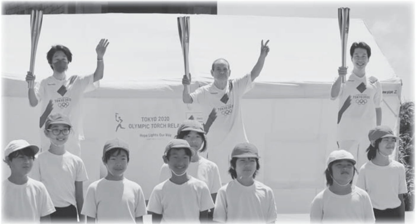
▲新島 聖火ランナーとサポートランナーの子どもたち