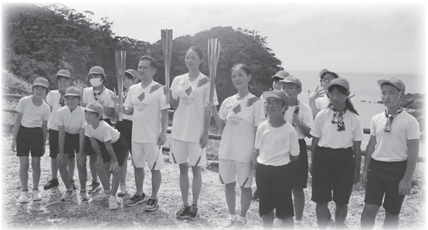
▲式根島 聖火ランナーとサポートランナーの子どもたち

7月15日、TOKYO 2020オリンピック聖火リレーが新島・式根島で開催されました。真夏の到来を告げる青い空の下、無事にリレーを実施することができました。 両島を巡った聖火は、各島を無事にわたり、その炎はオリンピック会場へとつながりました。 実施にあたりで協力いただいた関係者の皆さま、また、来場していただき祭典と共に盛り上げてくださった島民の皆さま、そして、聖火を繋いでくださったランナーの方々に感謝申し上げます。