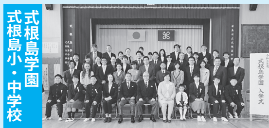
式根島小・中学校