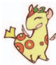
▲個人住民税PRキャラクター「ぜいきりん」