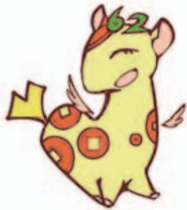
▲個人住民税PRキャラクター「ぜいきりん」