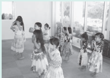
▲ケイキフラの様子 ※ ケイキとはハワイの言葉で子供

午前中は、フラやレイメイキングのワークショップが行われ、午後からフラやウクレレの演奏で会場を盛り上げました。他にもハワイアンジュエリー・雑貨、ハワイアンフードなどの出店や、大島や八丈島のフラサークルも参加し、盛大なイベントとなりました。