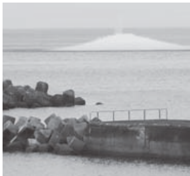
▲①水柱が上がる様子