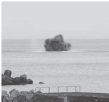
▲②黒煙が上がる様子