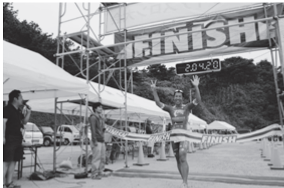
篠崎選手7連覇の瞬間

5月23日(土)、新島本村地区内で第24回新島トライアスロン大会が開催されました。 新島トライアスロン大会は、スイム1.5km、バイク40km、ラン10kmの総合距離、約52kmのタイムを競います。今年の当日エントリー数は502名で過去最多のエン