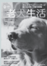
日本ペットシッター協会