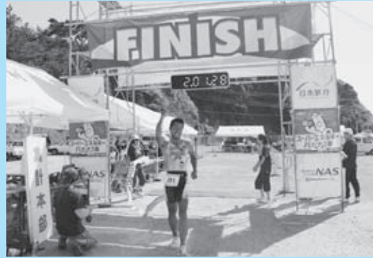
▲男子総合一位のゴールシーン