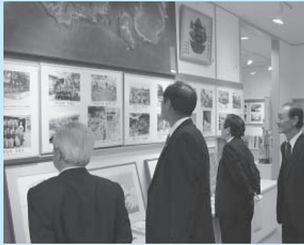
▶メモリアルルーム