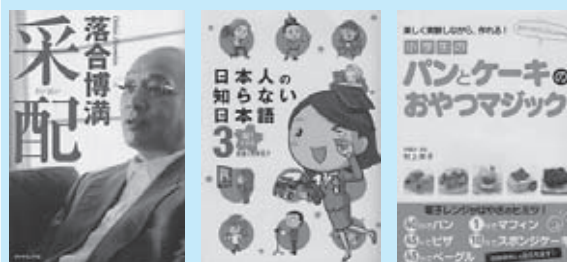
落合 博満 蛇蔵&海野 凧子 村上 祥子

助成金額 1事業につき100万円。 （助成支給対象経費の3分の2以内） 応募締切 5月18日（金） 審査・事業決定 応募頂いた事業は、運営委員会にて審査します。審査結果は市町村役場を通じて通知します。 事業実施期間 平成24年7月1日～平成25年2月28日 応募窓口 企画調整室 問い合わせ 企画調整室 企画調整室 ☎ (5) 0240 内線 203 または、財団法人日本離島センター総務部 ☎ 03(3591)1151