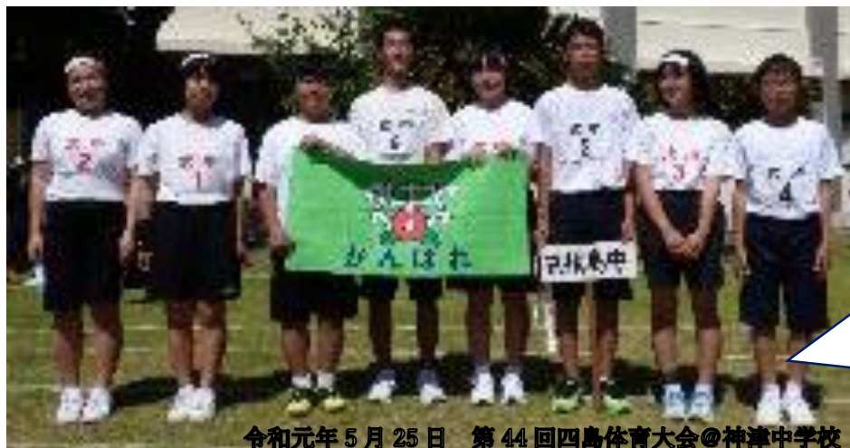
令和元年5月25日 第44回四島体育大会@神津中学校

今年度は8人しかいませんが、式根島の未来のために頑張っていきます！ご協力をお願いします。式根島未来会議にぜひいらしてください！