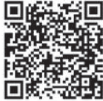
ウォーターセーフティガイド