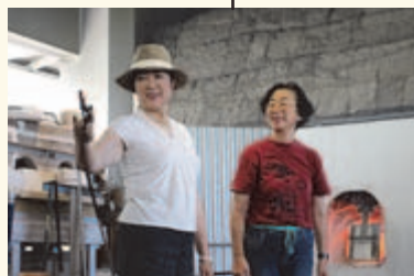
▲ガラスアートセンターにて新島ガラス製作体験