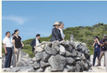
▲神引展望台から新東京百景にも選ばれている景色を眺望