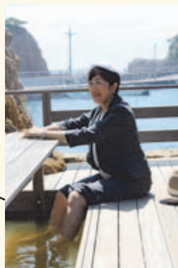
▲松が下雅湯にて足湯を体験