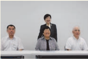
▲式根島にて島民との交流会『島の宝物』の紹介。