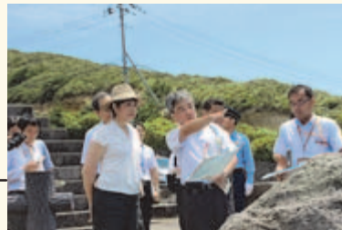
▲富士見峠展望台から本村地区を俯瞰し、港湾整備事業の説明を受ける