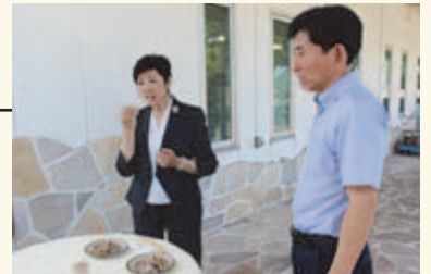
▲くさや加工工場団地見学後、くさやを試食