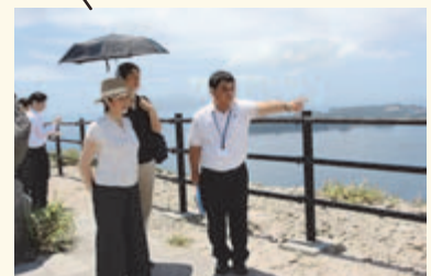
▲石山展望台にてコーガ石についての説明を受ける