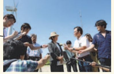
▲阿土山風力発電施設にてプレスの取材を受ける