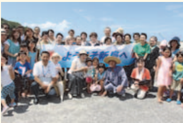
▲新島の皆さんからの歓迎