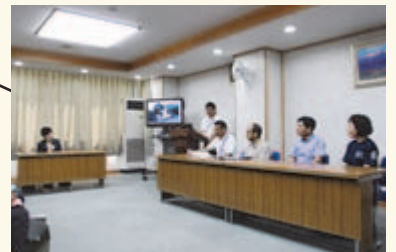
▲新島にて島民との交流会『島の宝物』の紹介。