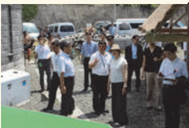
▲湯の浜露天温泉を見学