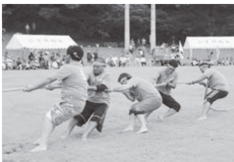
▶町会対抗綱引きのようす

10月2日(日)、いきいき広場で第36回新島村民運動会が開催されました。町会対抗リレーでは、2丁目が2年連続の優勝となりました。今回も新島中学校、新島高校との合同開催となり、多くの参加者で盛大に行われました。結果は次のとおりです。