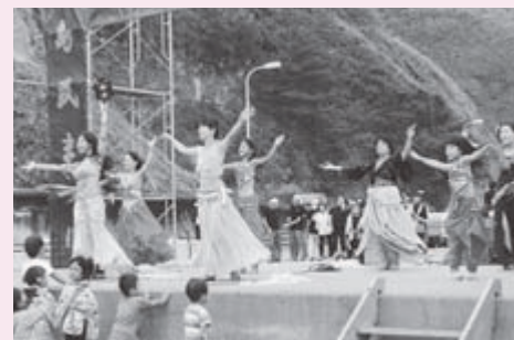
新島ペリーダンス