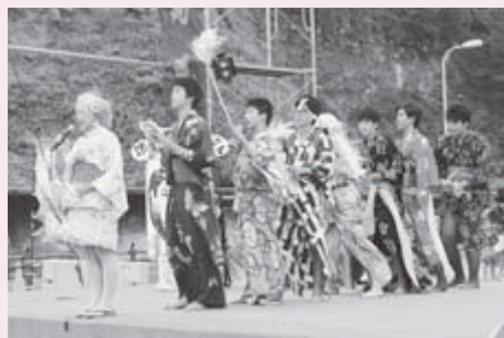
とみたまぼういず