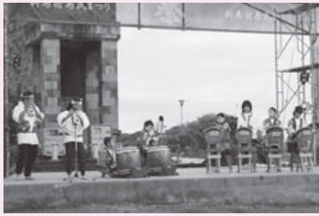
式根島大漁太鼓保存会