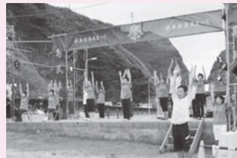
介護予防リーダーと水曜体操の会