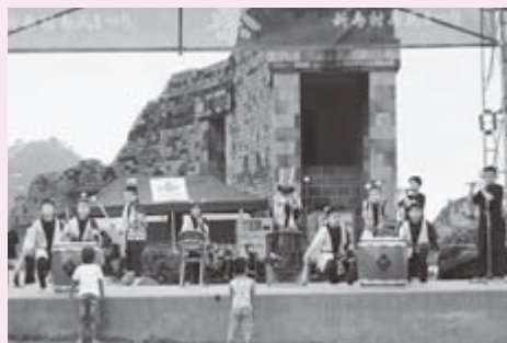
風神子供太鼓(3・4年)