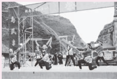
式根島歌舞同好会②