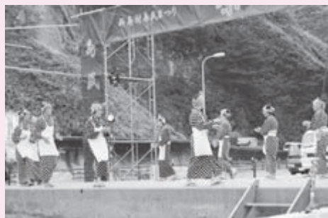
式根島歌舞同好会①