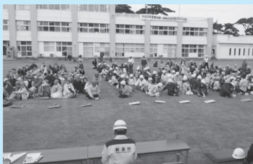
▲式根島地区、避難訓練。