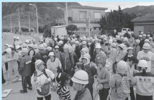
▲若郷地区、トンネル前に集合する住民。