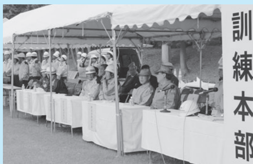
▲本村地区、訓練本部の様子。