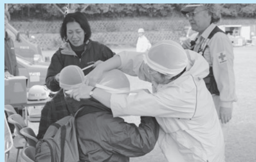
▲本村地区、応急処置。