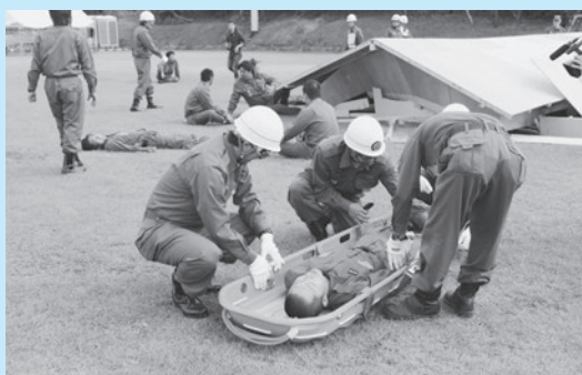
▲新島消防団の負傷者救助訓練。