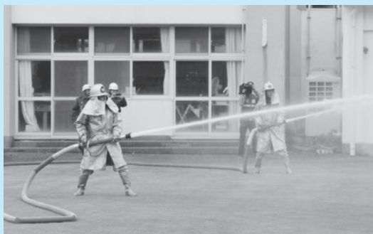
▲式根島消防団の放水訓練。