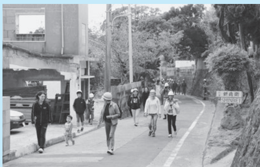
▲本村地区、一次避難場所へ避難。

9時11分に緊急地震速報9時13分に大津波警報が鳴り響くと、住民は一齐に予め指定された各地区の第一次避難場所に避難しました。その後本村地区では、最終避難場所とされている新島高校グラウンドへ、若郷地区は若郷トンネル前、式根島地区は式根島小学校へ集合しました。そして、新島高校と式根島小学校では炊き出し訓練が行われ、住民に炊き込みご飯などが配られました。 新島村では、3地区合せて人口の約60%、総勢1,727人の住民が参加。