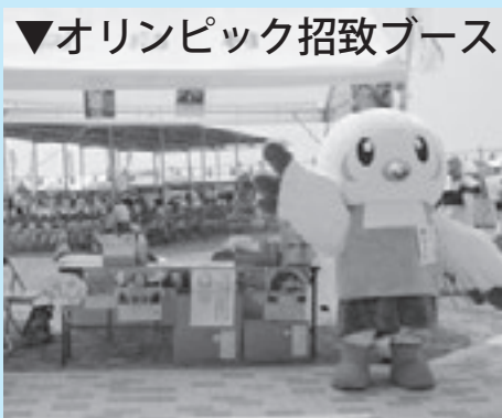
▼オリンピック招致ブース