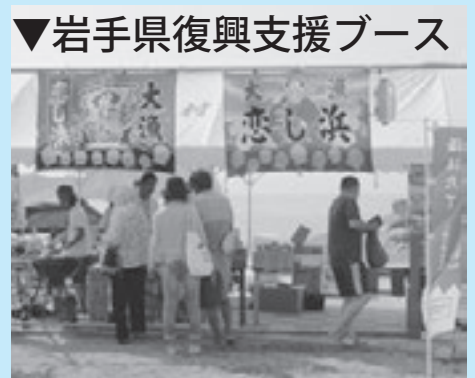
▼岩手県復興支援ブース