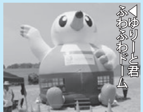
▲ゆりーと君 ふわふわドーム