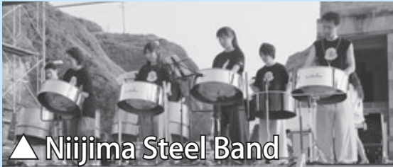
▲Niijima Steel Band