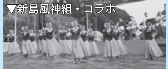
▼新島風神組・コラボ