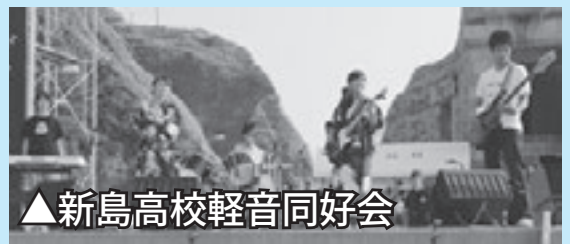
▲新島高校軽音同好会