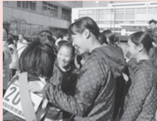
◀ アンカーの帰りを喜ぶチームのメンバーたち

1月19日、本村内をコースに第34回新島村民ロードレース大会と第42回新島村民駅伝競争大会が開催されました。ロードレースの参加者は158名(前年比2名増)。寒波が訪れ、新島には珍しく雪の降る中、レースがスタートしました。駅伝では、毎年参加頂いている羽黒チームや式根島チーム、一般参加のチームも多く、全31チームが出場しました。