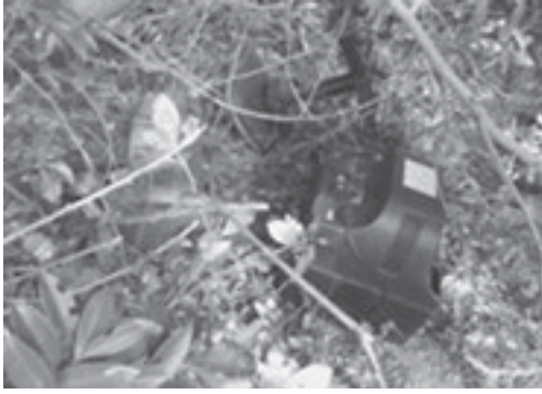
▶今回不法投棄されていた廃棄物（2月12日発見）