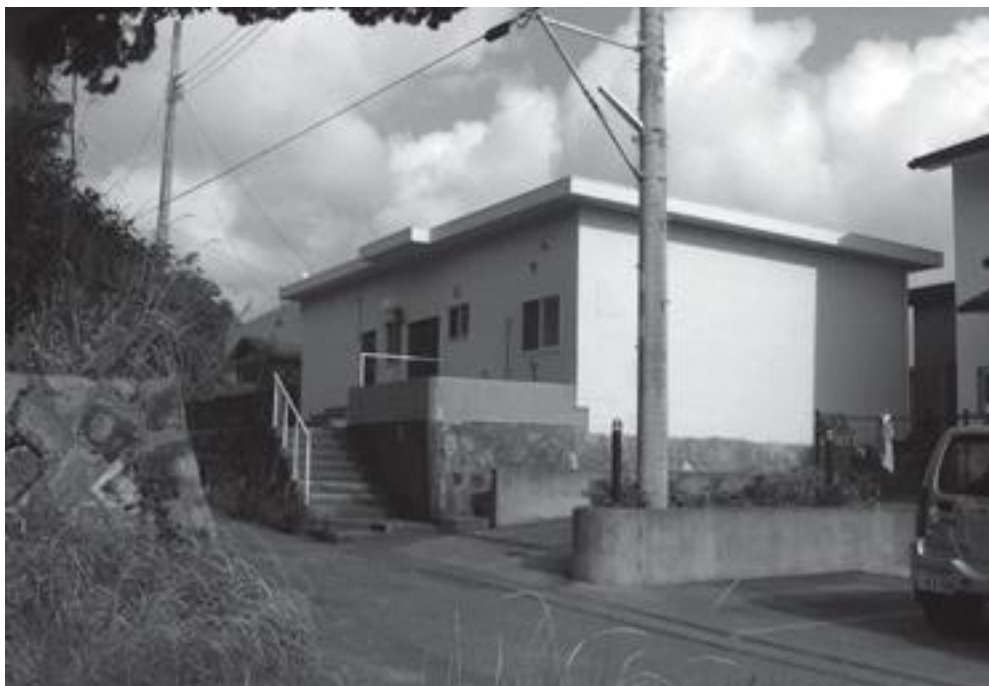
島外からの定住者のゲートウェイ

募は、ホームページへの掲載と、11月に実施予定の定住化イベントであるアイルンダーでの告知を予定している。また規定は、4月1日付で策定