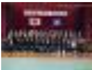
式典後の集合写真