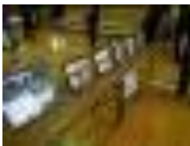
懐かしい写真たち