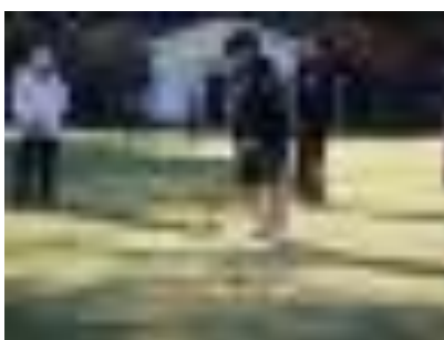
ゲートボール交流会