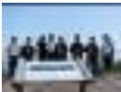
1,2年生神津島島外学習