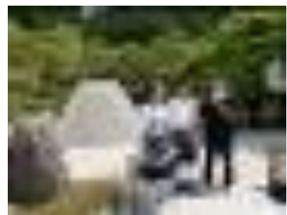
3年生京都・奈良修学旅行